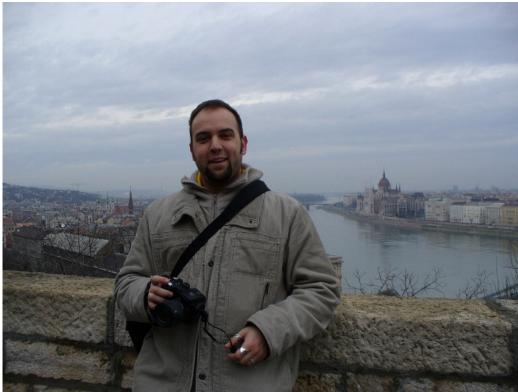
Il da kažem, malo mene tute ☺