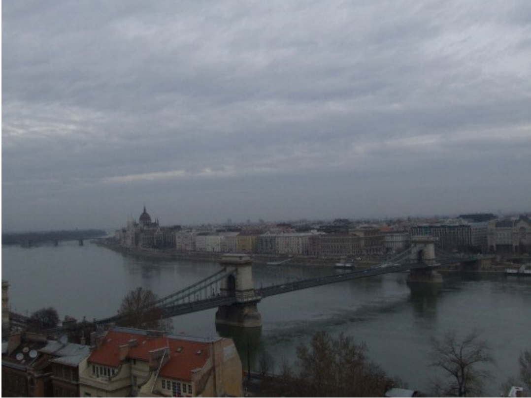
Malo Parlamenta, malo Lančanog mosta... ☺