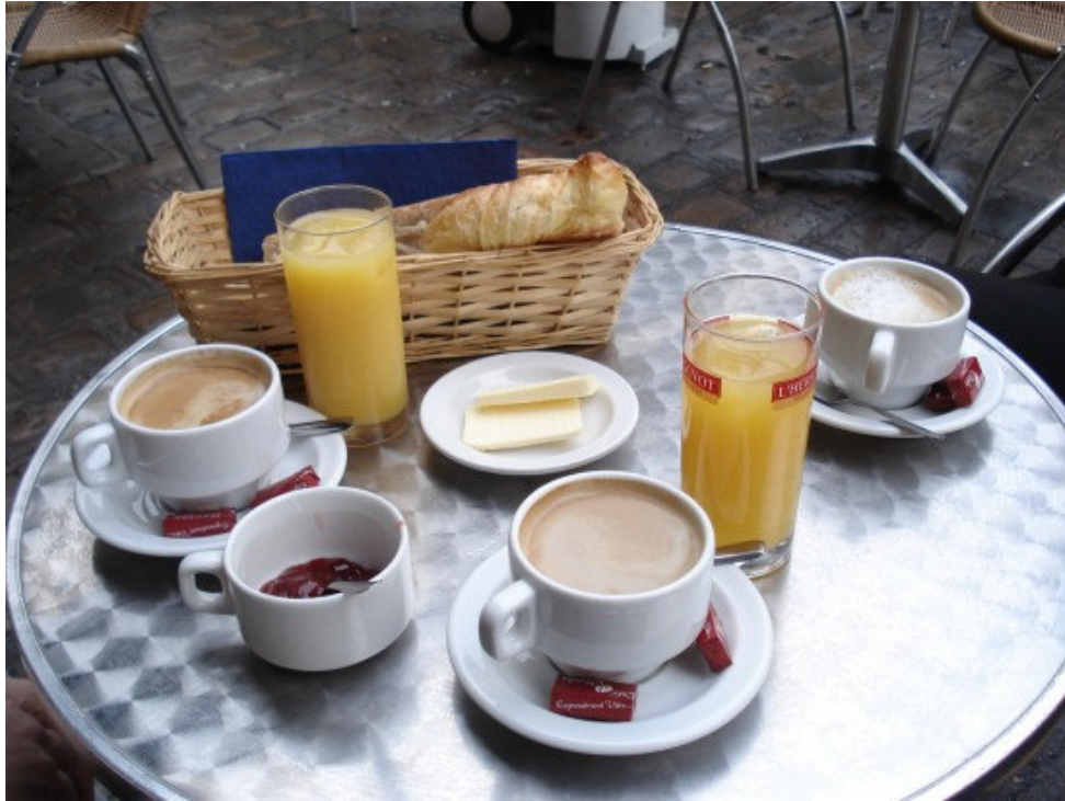
Našo se tu i maslac, i marmelada od jagoda... ☺