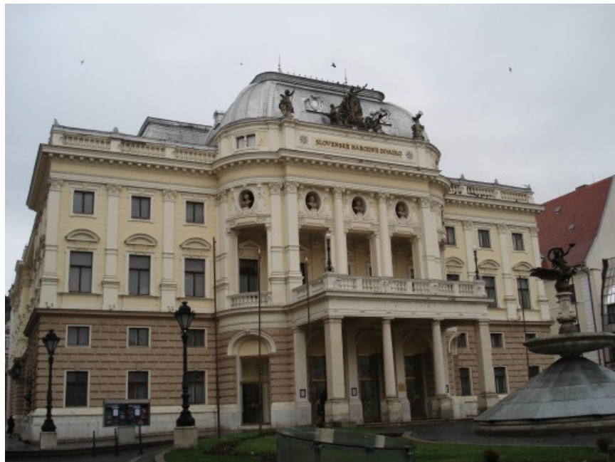
Kazalište je bilo gdje i prošli put....

Radilo se tako 2 dana, popisalo se šta fali i šta nam treba, pa, kako je ovdje signal bio jači (i dalje je interneta bilo u tragovima, ali je ove godine bar telefon funkcionirao pristojno), otišao malo u Cyber po neke stvari, i usput okinuo koju po gradu... Mislim, slikicu, slovakinju, tako mi mlijeka u prahu, nisam! ☺