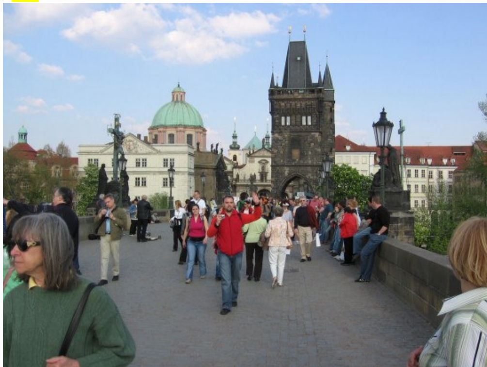
I malo po malo, stigli smo i do mosta! Cilj 1 – Osvojen! ☺