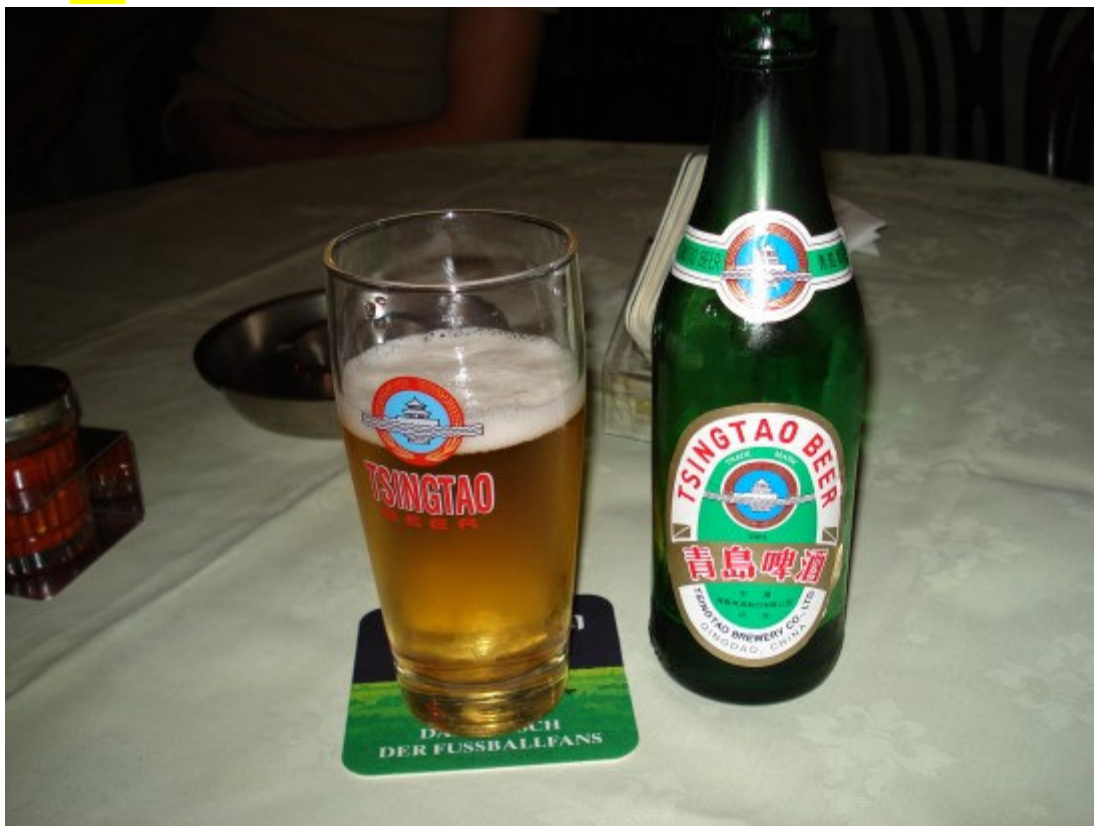
Najeli se i sve je slutilo na odlazak na spavanje... i napustili Peking ....