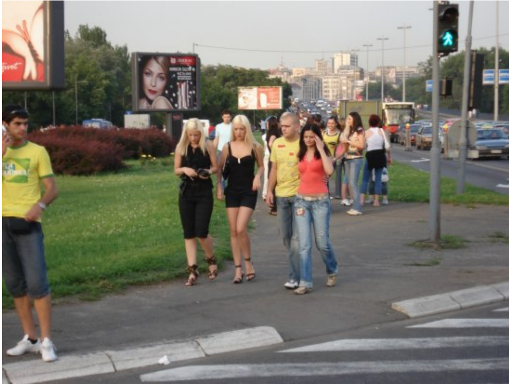
Pripreme za koncert su počele dobro, taksisti u ludnici, murija u stanju pripravnosti, a ljudi stižu ama baš sa svih strana, gdje god se okreneš, ljudi ljudi ljudi...