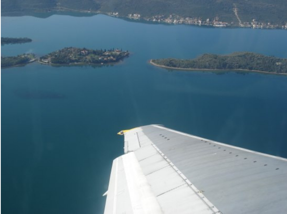
Bokokotorski zaliv, nikad plaviji i ljepši, a do Beograda se došunjao visoki Dunav...