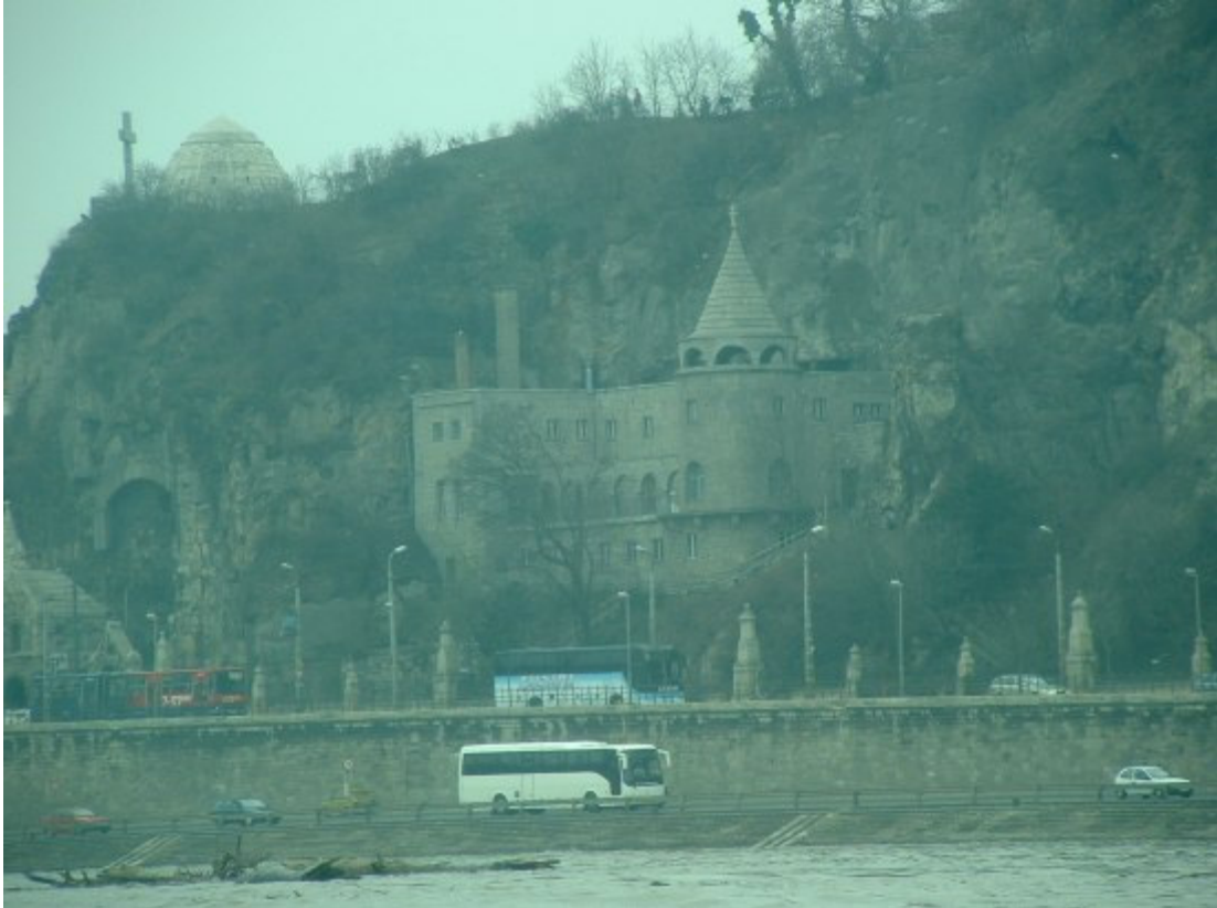
Ja sam se udobno smjestio i promatrao Budimpeštu ovaj put sa rijeke, a ne sa brda. ☺