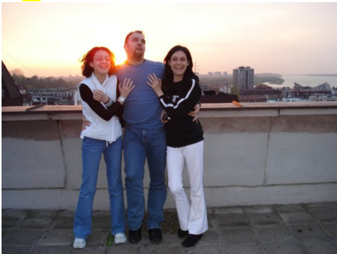
I ponovo jurnjava, jurcanje, trčanje nazad u Dubrovnik i na neke putešesije...