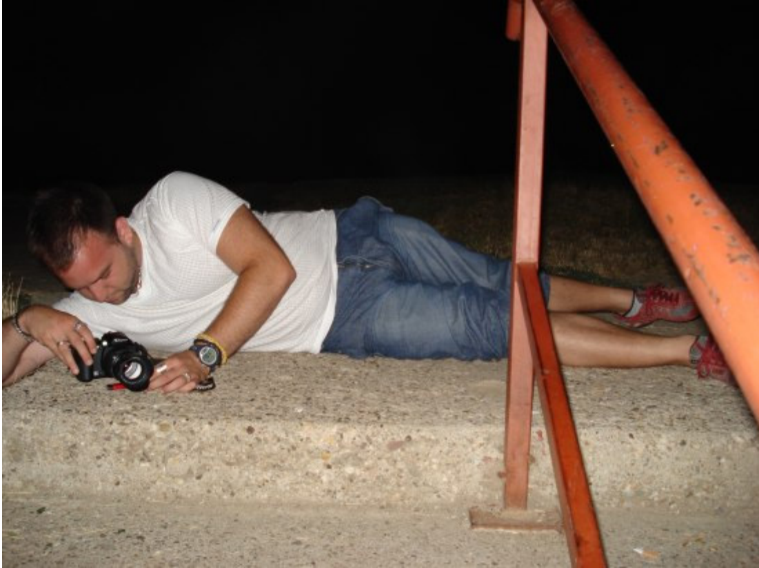
Ali zato slike ispadnu po mom ćeifu. ☺