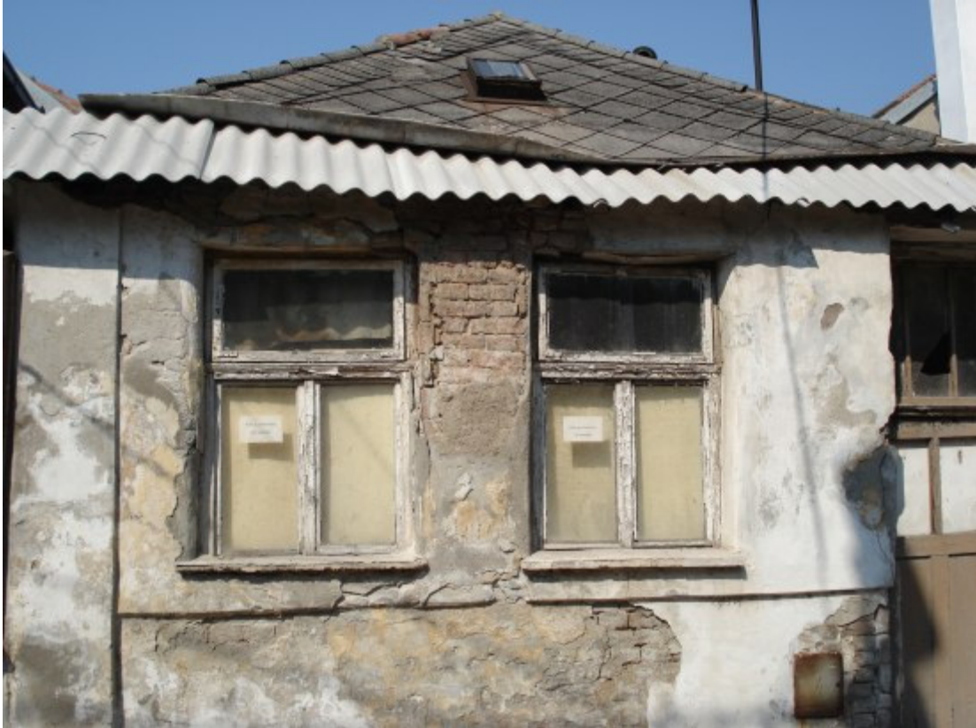
Ko ne vidi do prozora, evo... zooomoom! ☺