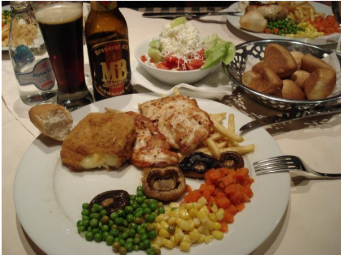
Mijac... MB, svetsko, a naše ☺ i to tamno! ☺