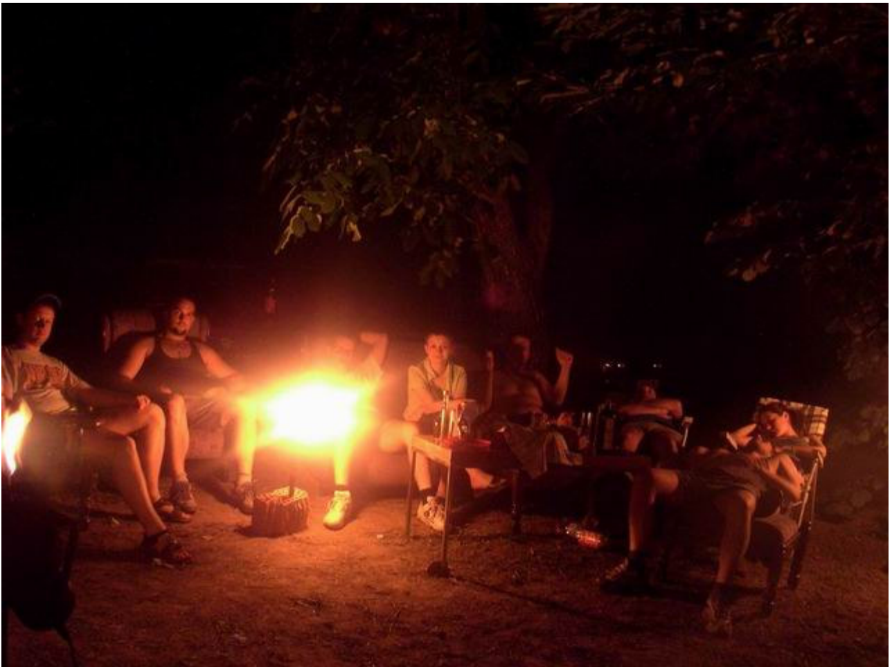
pa smo morali ici doma