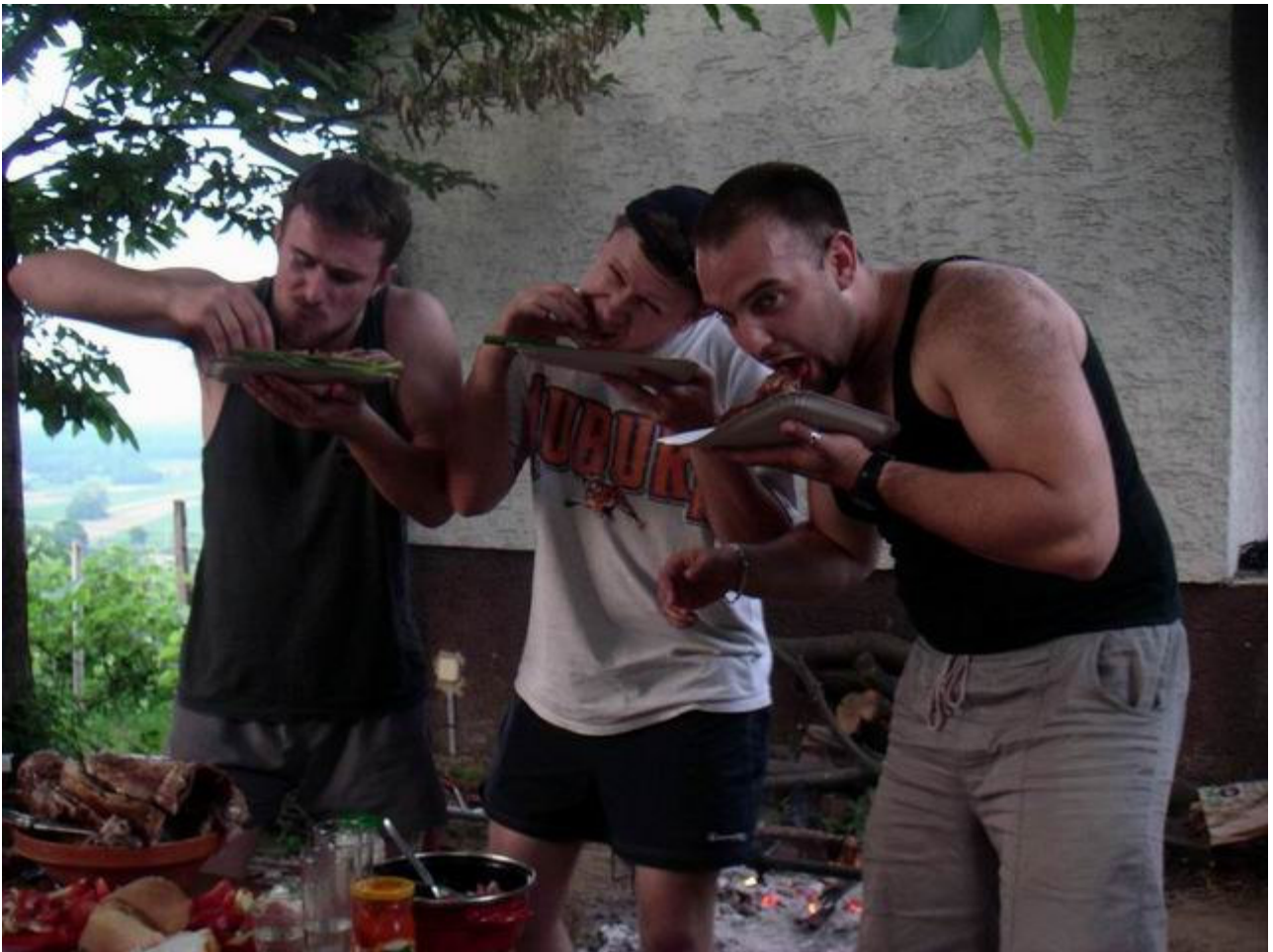
Relaksacija poslije vecere