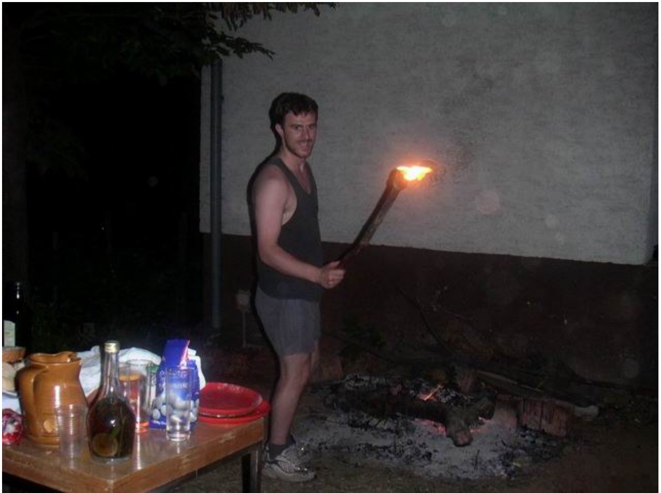
desnica nam je malo pospana