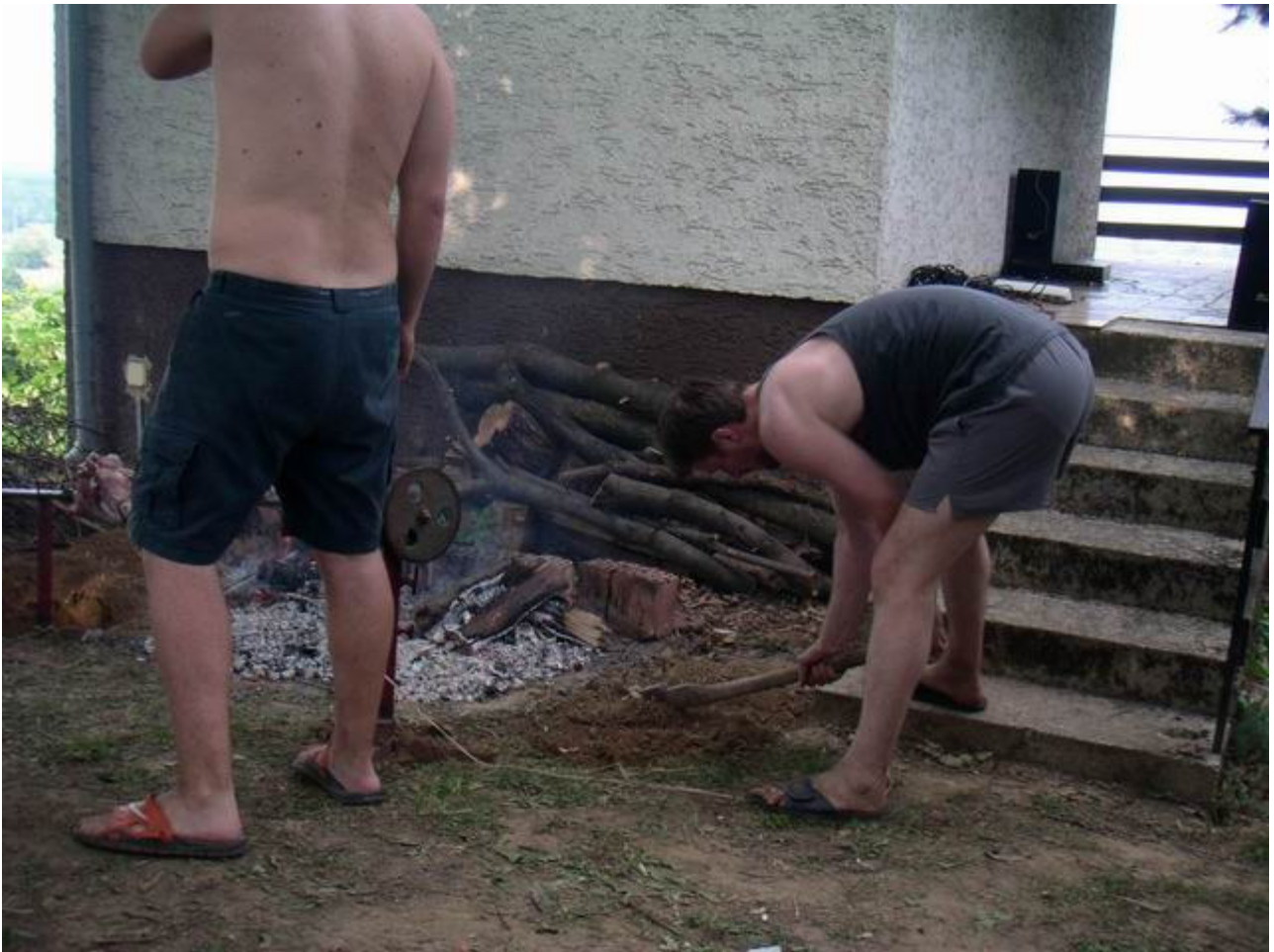
Ljudi mi smo gladni