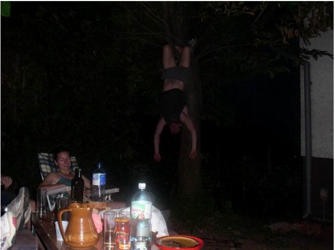
to vam je multinacionalna skupina