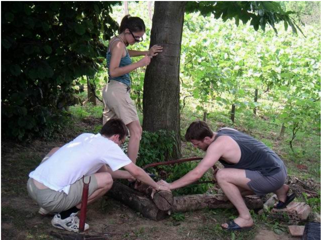
Da se vidi ko je gazda u kuci